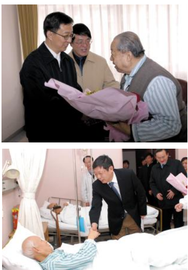
2月8日上午,中共上海市委副书记、上海市长韩正和中共上海市委常委、常务副市长杨雄来我院亲切慰问了在干部病房住院治疗的老干部,祝愿他们早日康复,并致以新年的问候。上海市组织部副部长陆凤妹、上海市教卫党委书记李莹海、上海市卫生局局长徐建光以及我院院长朱正纲和党委书记严晋等陪同慰问。