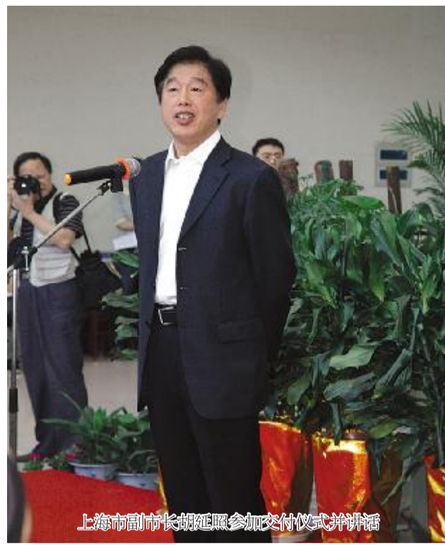
上海市副市长胡延平参加交付仪式并讲话