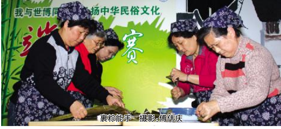
裹粽能手