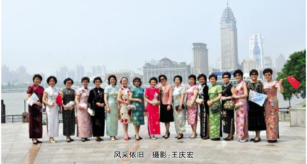
风采依旧