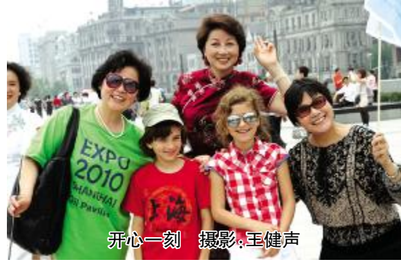
开心一刻