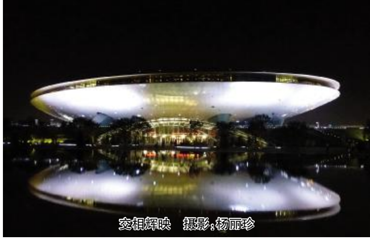
交相辉映