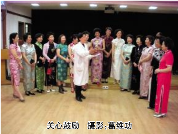
关心鼓励