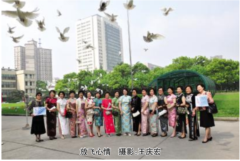
放飞心情