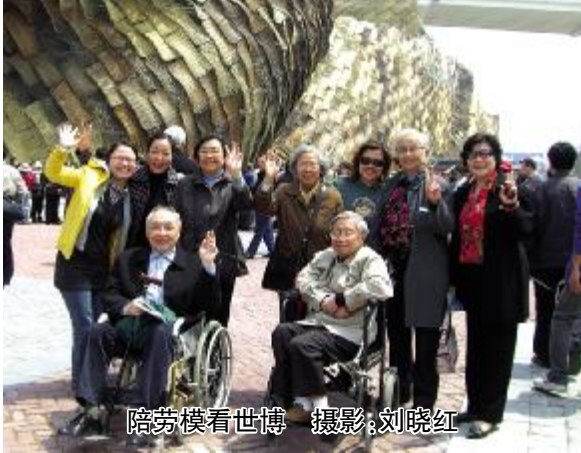
陪劳模看世博