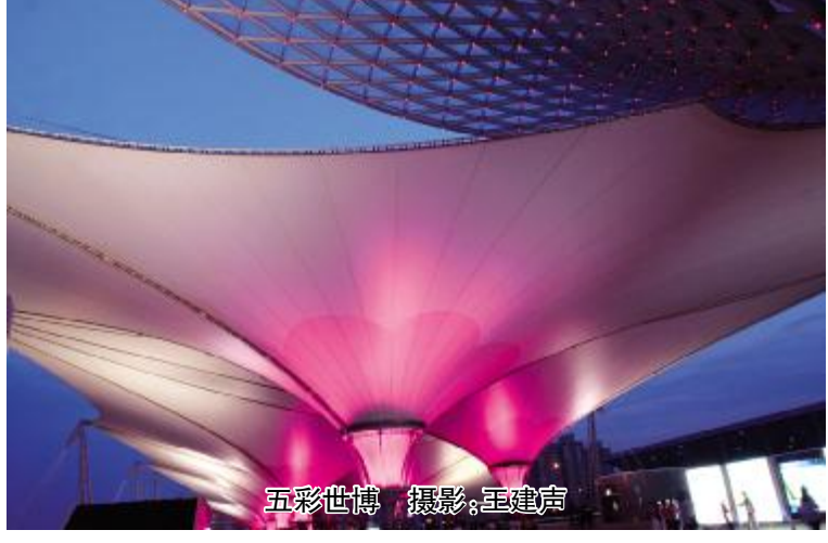
五彩世博