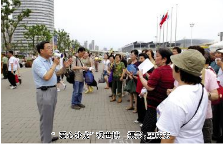
“爱心沙龙”观世博