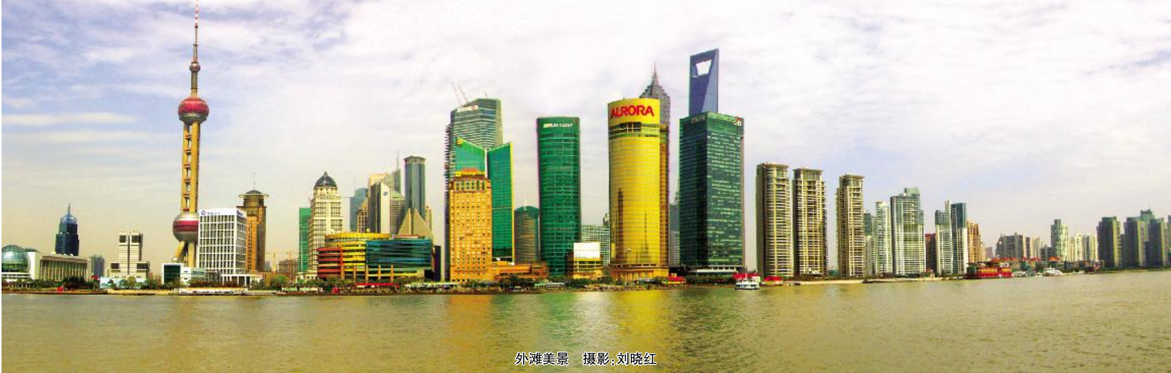
外滩美景