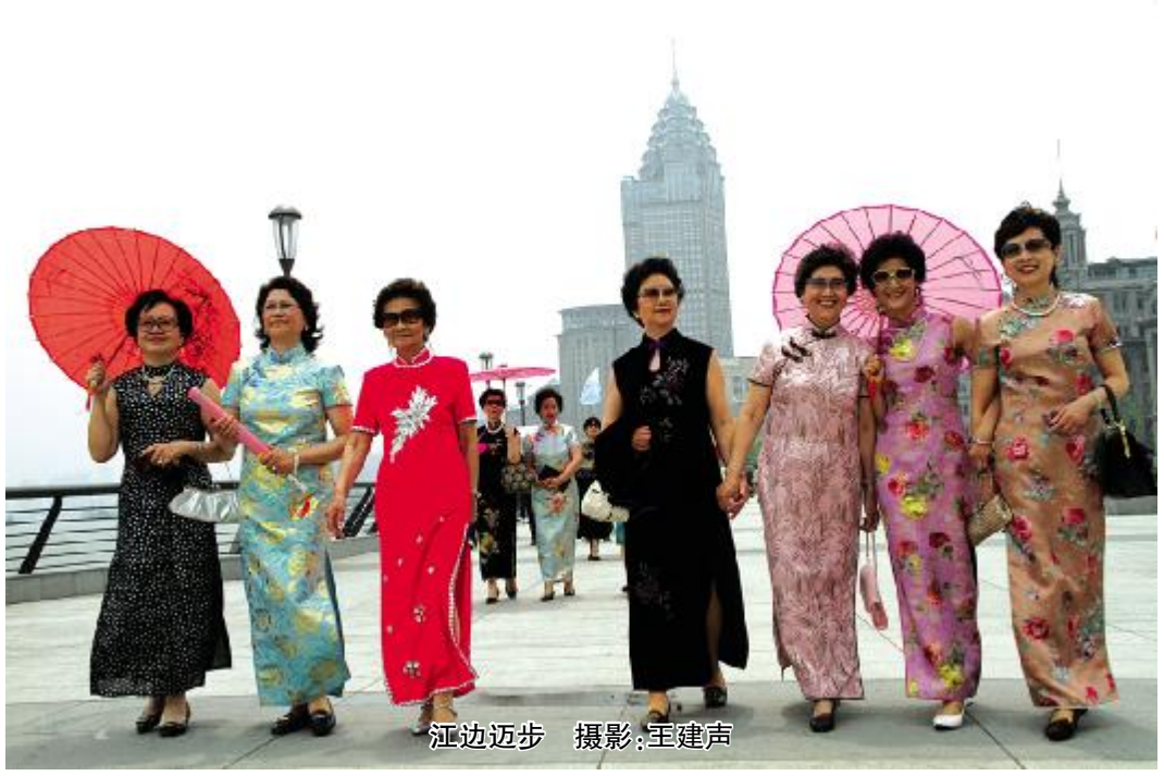
江边漫步