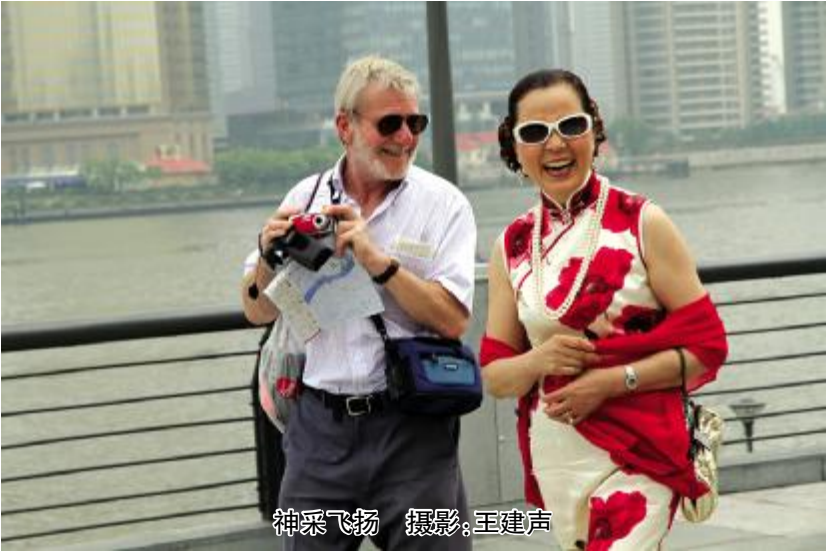
神采飞扬