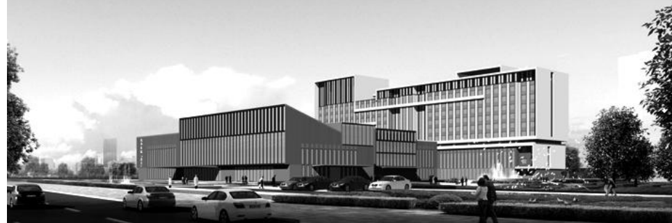
(瑞金医院北院效果图)

编者按：本版推出“北院之家”栏目，以文字、图片的形式将北院的建设和发展情况传递给广大职工和读者，让大家更清晰、更直观地了解瑞金医院北院的各种信息。