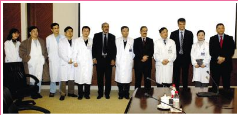
12月23日,摩洛哥卫生部秘书长麦卡维率摩洛哥卫生部代表团一行6人来院访问,双方就多年援摩工作进行了回顾,并对今后的合作发展充满希望,交流后代代表团还饶有兴致地参观了中法实验室、烧伤科病房及急诊大楼。