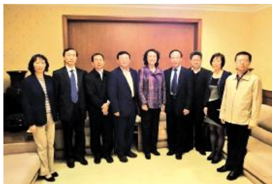
□ 通讯员 李菲卡 摄影 苏征佳

要载体,生物安全培训和生物安全演练已经成为目前医院推进安全管理工作的重要手段。以上内容已成为全院实验室的常态化工作项目,并收到了良好效果。