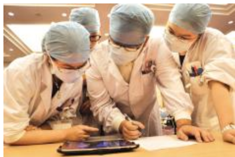
□ 通讯员 刘旭 陈怡

本报讯 近日,由瑞金临床医学院与瑞金外科教研室共同举办、瑞金临床医学院学生会承办的第二届“柳叶锋情”外科节系列活动之“Amazing Hands”外科技能操作比赛在科技楼二楼报告厅举行。此次“柳叶锋情”外科节