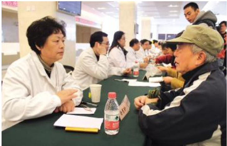
□ 通讯员 顾震瑶

本报讯 11月24日上午,在即将落成启用的北院门诊大厅举办了“嘉瑞齐心,慈爱传承——瑞金医院北院开院系列活动之大型义诊活动”。瑞金医院普外科、心内科、普胸外科、内分泌科、神经内外科、骨科、皮肤科等十多位专家教授现场咨询释疑,中医科专家许建中主任还就“冬令进补”这个大家近期关注的话题进行了健康讲座。据统计,2个小时内共接待问诊近300人次。