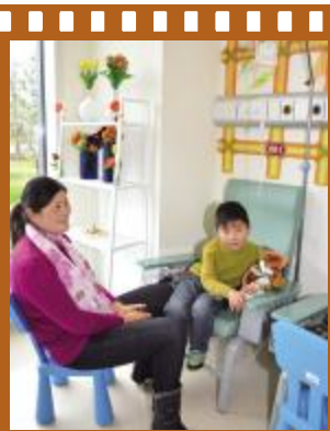
第一位补液的小患者