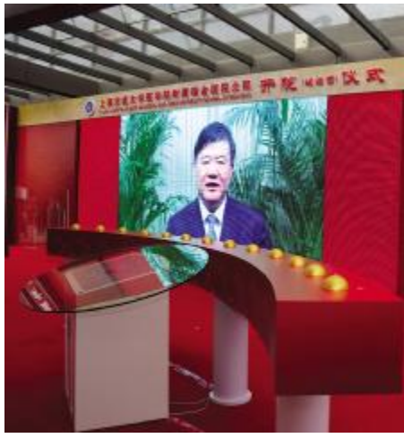
卫生部陈竺部长视频祝贺