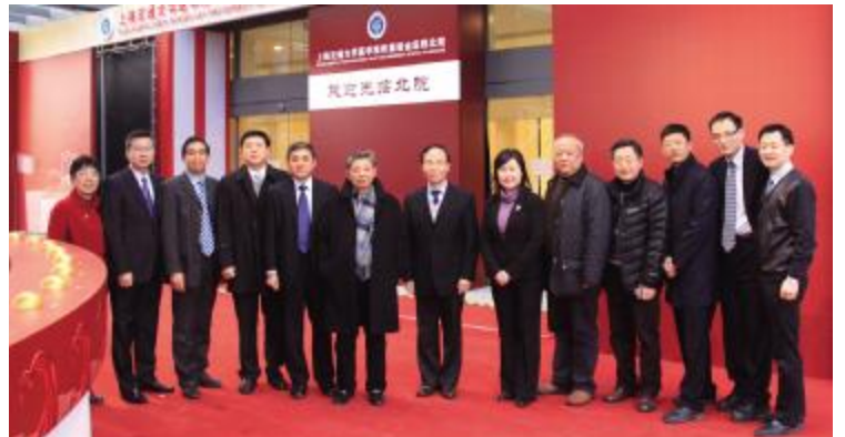
瑞金医院北院院领导合影