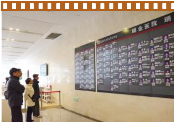
病患关注专家介绍墙