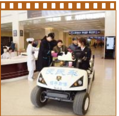
门诊大厅内的便民车