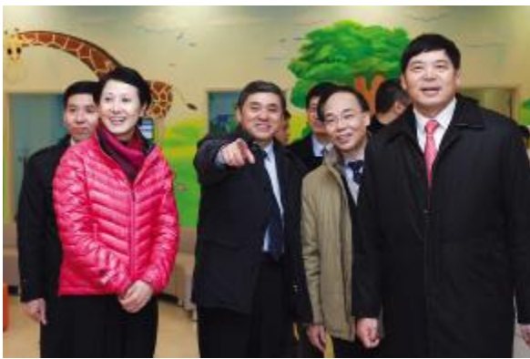
温馨的儿科门诊吸引了参观的嘉宾