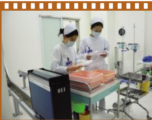
智能化轨道小车开进补液室