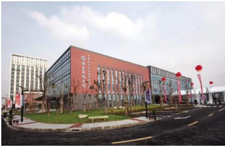
充满节日气氛的瑞金医院北院