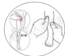
— 足三里 —

迎香也是常用的人体穴位之一,属于手阳明大肠经,中医认为大肠经和肺经互为表里,所以肺病也通过大肠经的穴位进行治疗。此穴在鼻翼外缘中点旁,当鼻唇沟中,揉搓迎香穴对缓解鼻塞有明显作用。