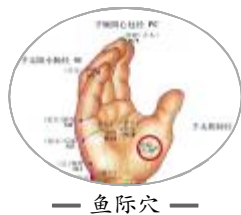
— 鱼际穴 —

中医经络学理论认为每日擦热鱼际穴可以清肺止咳,咳嗽重可加孔最穴,咽喉不适加列缺穴。这三个穴位都属于十二经脉里的肺经,其中鱼际穴最为常用。