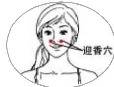
— 迎香穴 —

鱼际位于第1掌骨中点桡侧,赤白肉际处,老百姓通常说的大鱼际就是这个穴位的分布点。我们每天都可以自己进行揉搓按摩,每次以擦热为宜,具有清肺泻火,清宣肺气的作用。可治疗咳嗽气喘、胸闷胸痛、咯血、咽喉肿痛、声音嘶哑等。