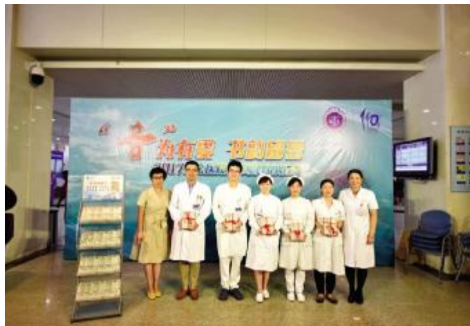
□记者 李晨

本报讯 8月24日,我院门诊大厅飘来了悠扬的音乐与动人的歌声,不少前来就诊的患者与家属驻足聆听观看,“因为有爱,书韵留香”瑞金夏季门诊音乐会正在举行。今年的音乐会还增设了书香主题,向病患赠阅《医学不能承受之重》一书,希望市民更多理解医学,理解医院,理解医生。