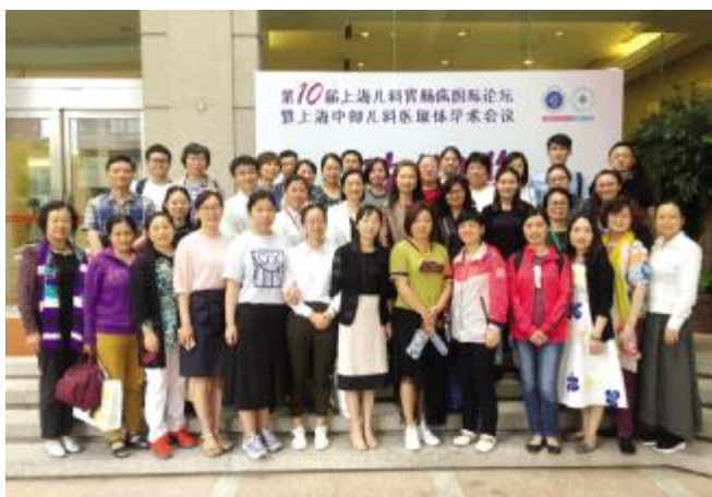
6月1日-6月5日,2018年上海市继续教育项目《儿科胃肠病新技术新进展》暨第二届儿科中部医联体学术会议在我院成功举办,共吸引全国16个地区260名学员参加。

到正向推动项目管理的作用。王惟表示,关于财政性科研类结转结余资金的问题,各部门要定期向医院党政领导班子汇报相关财政性专项资金的执行情况,充分反映目前管理工作中存在的主要问题和项目的数量金额,促进业务部门和财务部门的工作相融合。卢华也表示,医院专项资金的管理要科学化和精细化,可考虑采用适度信息公开、项目全生命周期预算管理等方式为抓手,进一步推动项目资金的合理有效使用。